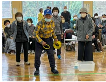
高齢者の健康づくり （講話と輪投げ交流）