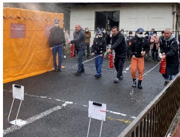
いざという時の防災訓練を地域で実施