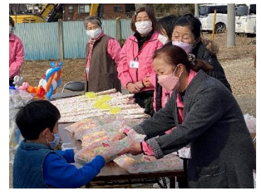
新入生へ入学記念品を配布