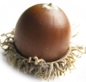
クヌギ、アベマキ、カシワ