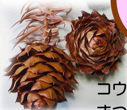
コウヨウザンの まつぼっくり