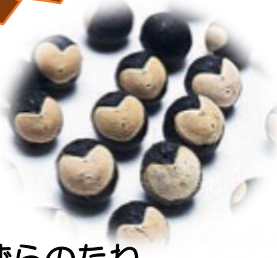
ふうせんかずらのたね