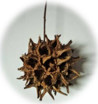
フウ、プラタナスの実