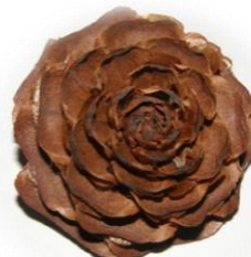
ヒマラヤスギの まつぼっくり