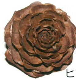
ヒマラヤスギの まつぼっくり