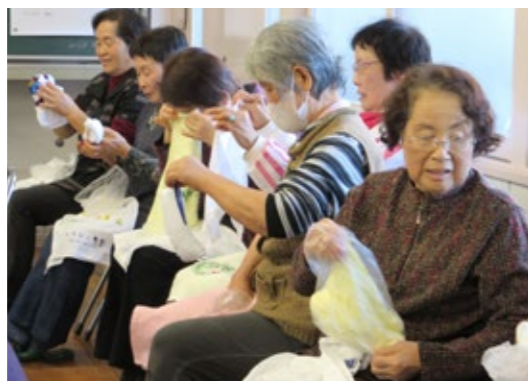
ホットタオルも簡単に作れます

また今回は、日本赤十字社茨城支部指導員のお二人から、災害時高齢者支援として講話と実際に避難所で使える毛布ガウン・ふろしきリュック・ホットタオルの作り方やマッサージの仕方などの実技の両方から役立つことをたくさん学びました。