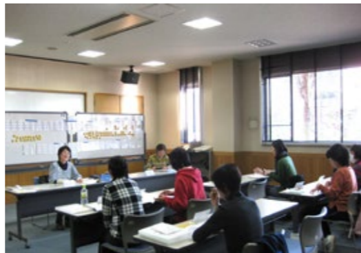
▲皆さん熱心に聞いてくださいます！