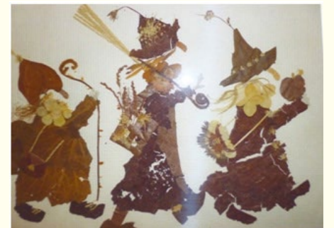
▲草間和子作 『魔女達』

現在は私も仲間に入れてもらい、野草に思いを込め、名を覚え、楽しい一時をすごしています。（前橋）