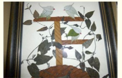
▲前橋ナツ工作 『小鳥のおしゃべり』