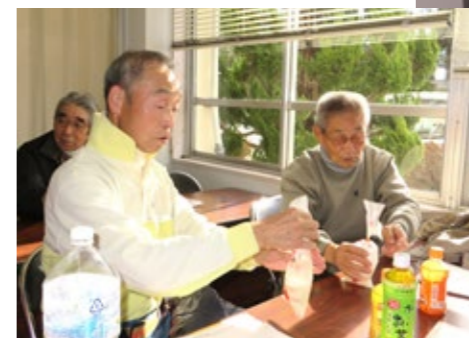
▲ビニール袋で炊き出しなんてすごいですね