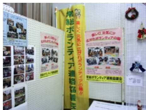
▲公民館でのパネル展示

今年も様々なイベントを利用して、パネル展示、のぼり旗、ティッシュ配布などでボ連協のPR活動を行いました。