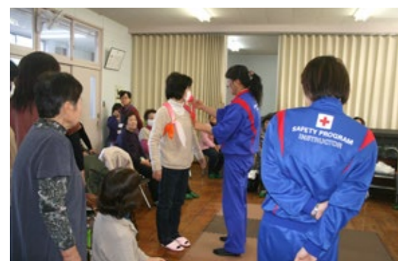
▲ふろしきリュックを作っています