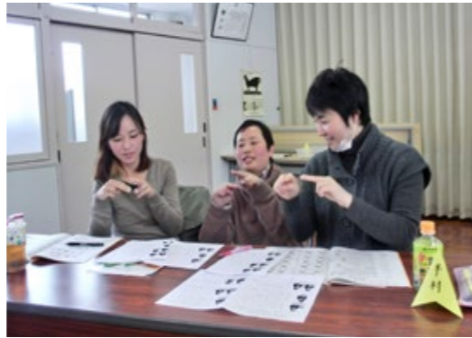
▲楽しく学んでいます！