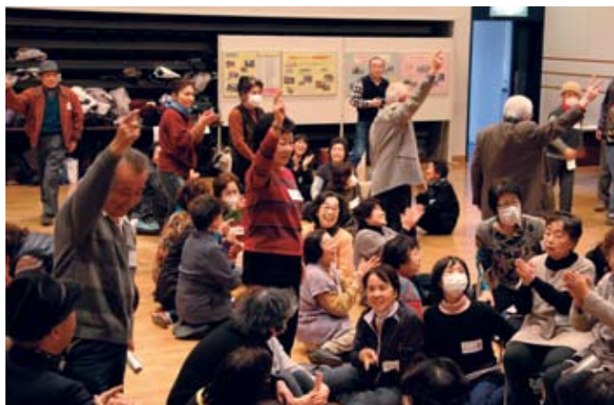
▲家族の一員となって、鍋の具を集める「スキヤキじゃんけん」で会場也大興奮。

サークル間の垣根を超えた仲間作りができた楽しいひとときでした。(みなさ～ん、後日からは痛くなりませんでしたか～?)