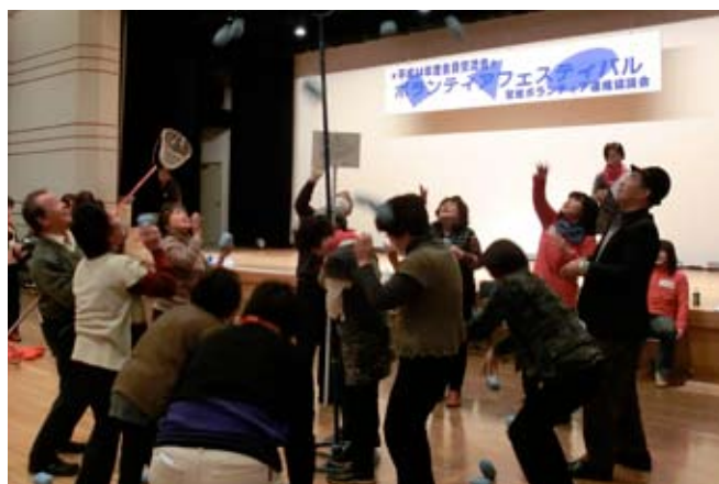
▲お昼を食べた後は、「玉入れ」！皆さん夢中になり、頭上のカゴと格闘していました。