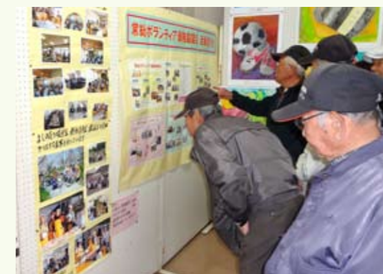
▲みなさん熱心に見ていただきました