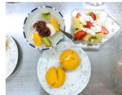
▲すてきなデザートができました！

11月28日、ボナペティさんを講師にむかえデザート作り研修会を行い、簡単にできるデザートを3種類教えていただきました。いつものお食事会で短時間で作るということだけあって、本当に簡単にできて、しかも見た目もきれいで、何よりおいしいデザートでした。参加した方々はベテランの主婦の方も多く、つつい先走ってしまうこともあって、講師は大変な場面もあったようですが、他のサークルの方々と和気あいあいと美味しい時間を過ごすことができました。