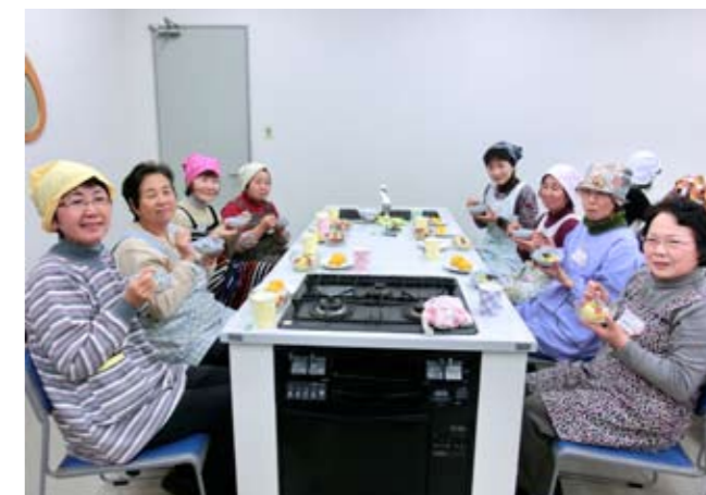
▲やっぱり食べるのが一番♪