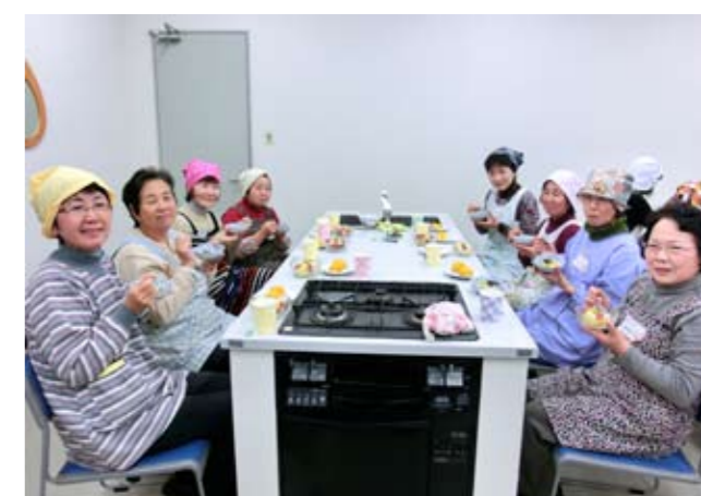
▲やっぱり食べるのが一番♪