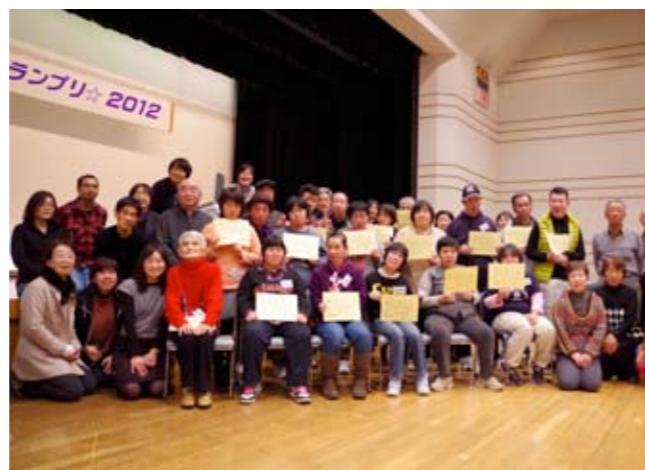
▲歌い終わって大満足の笑顔！！