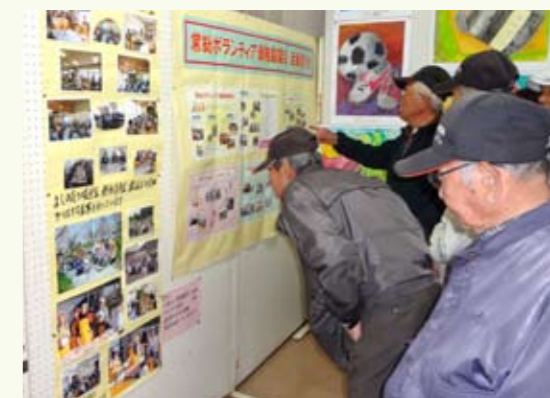
▲みなさん熱心に見ていただきました