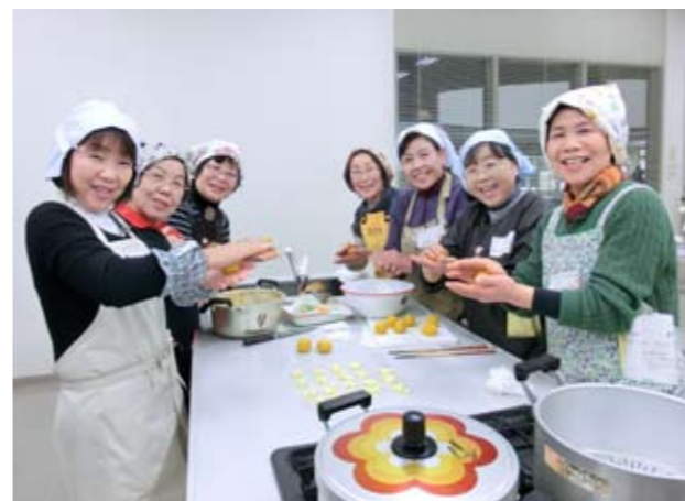
▲美味しいものを作るのは楽しいわ