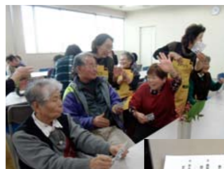
▲食後のレクリエーションも楽しみです