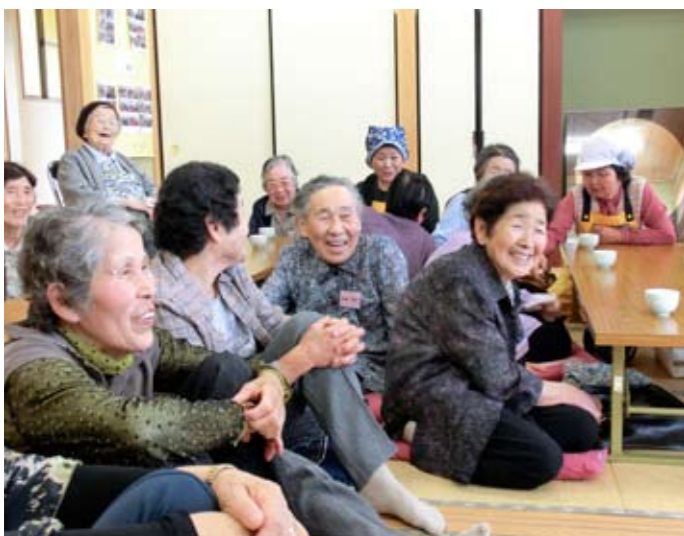
▲自然に笑顔になります