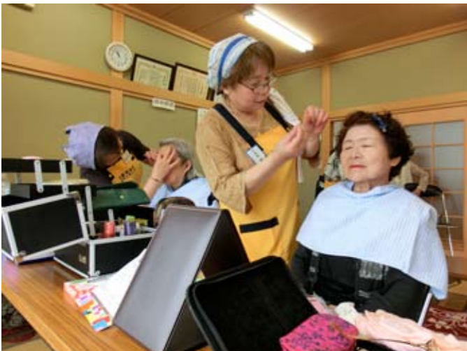
▲プロの美容師さんのメイクアップ