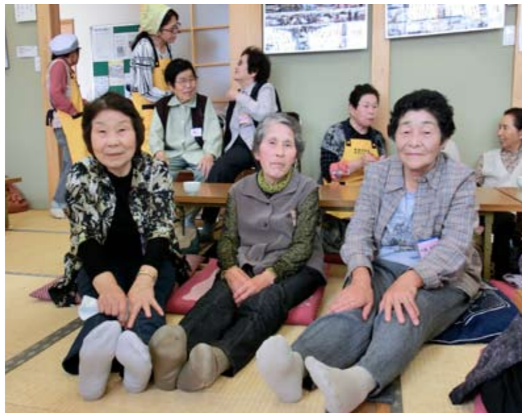
▲みんなきれいになりました♪