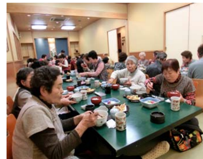
▲美味しい料理に思わずにっこり