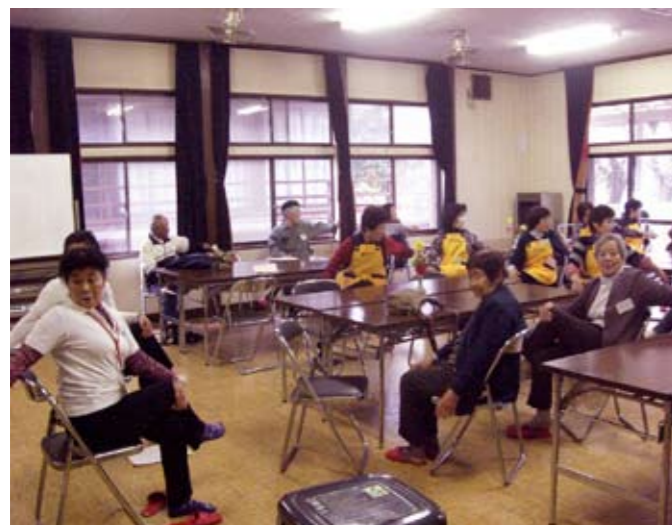
▲体を伸ばすと気持ちいいです