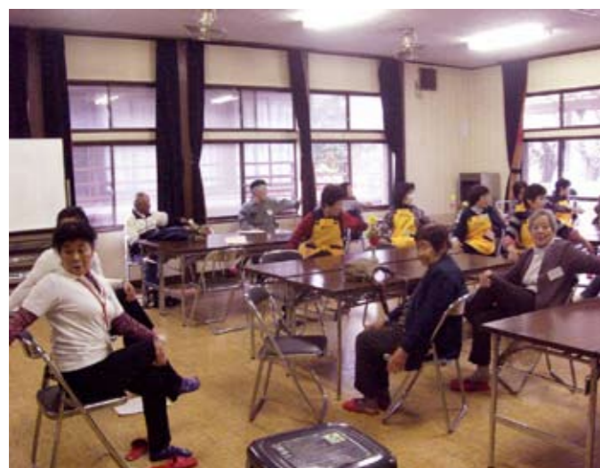
▲体を伸ばすと気持ちいいです