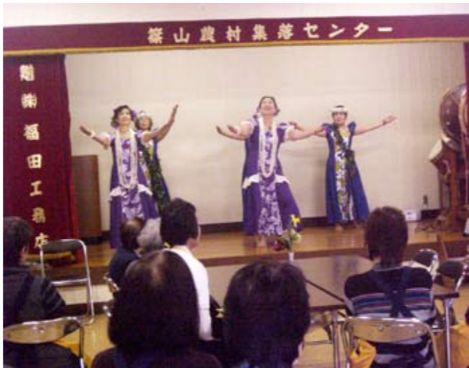
▲ステキなダンスにうっとり