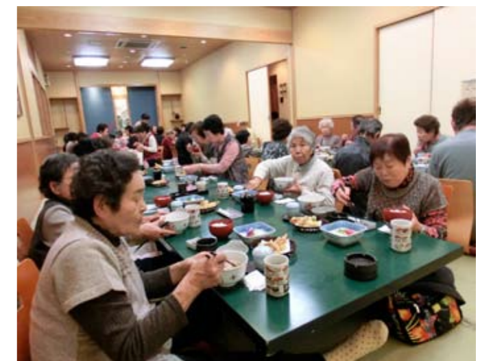
▲美味しい料理に思わずにっこり