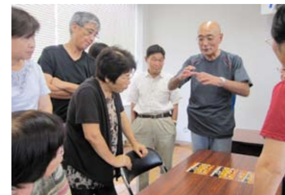
▲きれいな写真をいっぱい撮りたいな

また、室内は室内パーティーモードにし、外が明るい場合ストロボを使う、動きのあるものを撮る時には連写で撮ることがポイントです。今のカメラは性能が良いので説明書を読んで使うと、より美しく撮れる事がわかりました。自分の趣味や楽しみがボランティア活動になることも発見でした! 今後のたんぽぽの取材で撮るのが楽しみです。(たんぽぽ編集委員 木村)