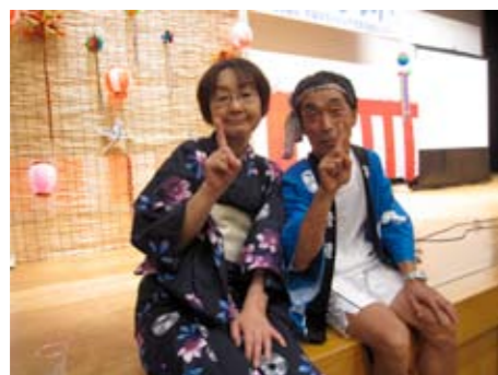
▲司会のふたりは衣装から気合が入っていましたね♪

一人ひとりの小さな力が集まって、外の暑さに負けない位の大きな熱いパワーが会場内に広がった一日でした。皆さん、暑い中お疲れ様でした。