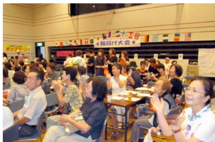
▲たくさんの方にご来場いただきました