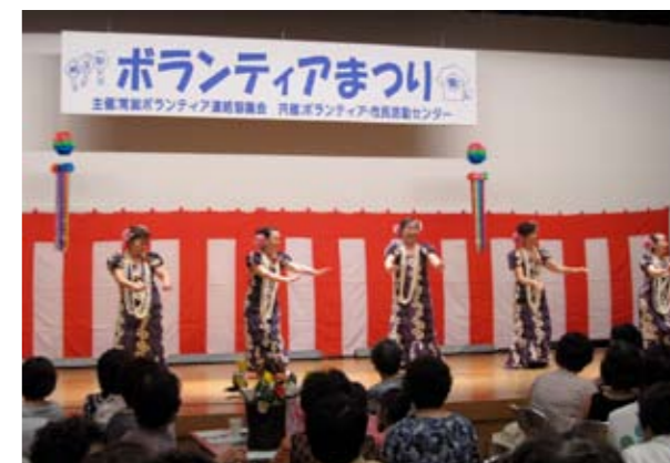
▲フラダンスで健康作り!