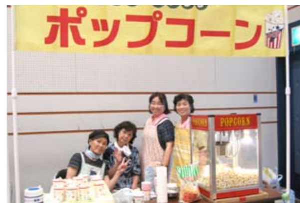
▲食べて、笑って、みんなで交流!