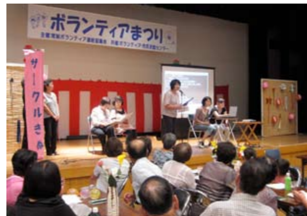
▲たくさんのグループが発表してくれました