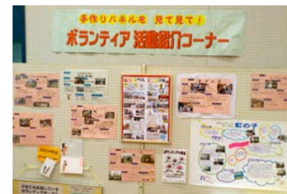
▲手作りパネルなどで活動紹介