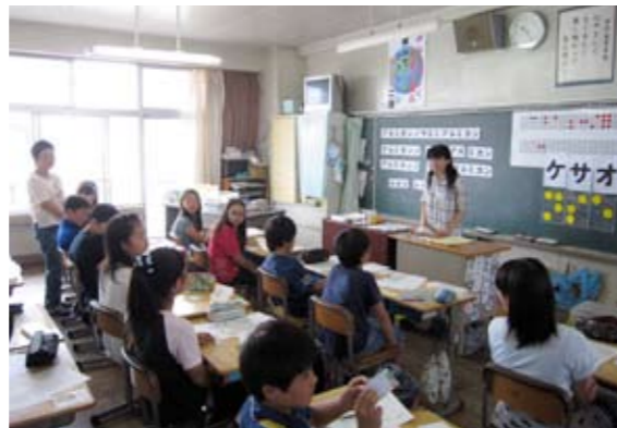
▲みんな一生懸命聞いてくれました