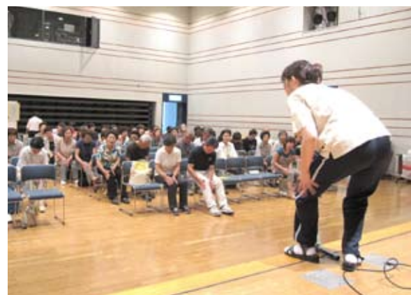
▲健康体操で体も心もリフレッシュ！