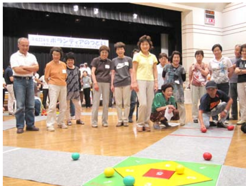
▲オーバルボールで交流！