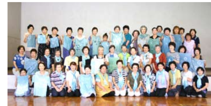
▲素敵な作品ができました！

その後、よく水で洗いゴムを外し、出来栄を評したり……楽しい時間でした。係の方、ご苦労様でした。（おたっしゃくらぶ 大森）