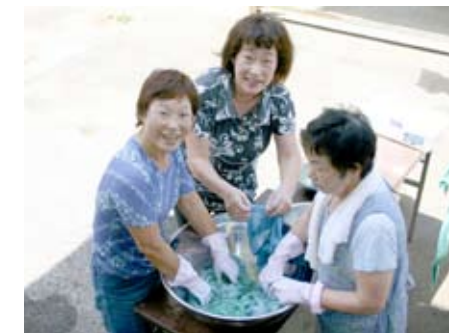
▲さあて、きれいに染まるかな

●私にとって藍染めは、初めての体験でした。葉を揉んで汁に布を浸し、空気にさらす度色が変わり、世界に一つのハンカチが完成しました。