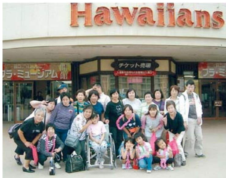
みんなで記念撮影。最高の笑顔でバッチリ！ ▶